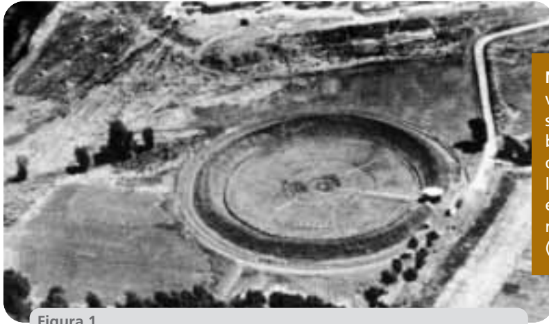
Figura 1 Campo gamma nel Centro Ricerche Casaccia

NB: Gli esperimenti, dapprima volti a conoscere la radiosensibilità delle piante, furono ben presto indirizzati allo studio degli effetti genetici delle radiazioni (Radiogenetica), e poi a determinare mutazioni utili nelle piante agrarie (Mutagenesi)