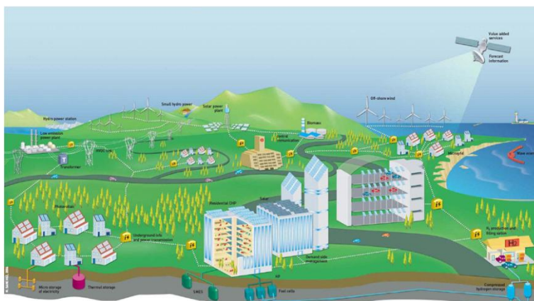
Smart grids (monitoraggio e controllo adattivo)

Attualmente la società è impegnata nella messa a punto di un sistema per la gestione intelligente di parchi eolici, e nella messa a punto di un controllo intelligente dei flussi di potenza ( smart grids ) per evitare fenomeni di saturazione nelle reti elettriche.